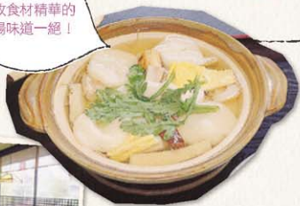
Guzouni Himematsuya 貝雄煮 姬松屋