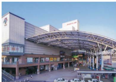
AMU PLAZA Nagasaki アミュプラザ長崎

長崎市元船町10-1 ☎095-823-3133 9:30~22:00 ※無公休(一部分店鋪除外) 收費P850台