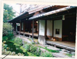
Shimabara Mizuyashiki しまばら 水屋敷 島原 清水屋邸

用地下湧出的泉水冰鎮小湯園，再放入特製糖水中，就成為島原的知名甜點寒湯園(寒ざらし)，圓潤的湯園容易入口，糖水也甘甜不膩。擺設了許多招財貓的店鋪吸引遊客目光。