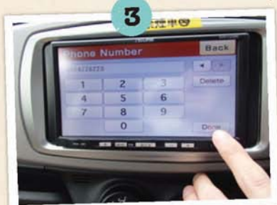
輸入電話號碼後點選「Done」