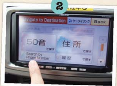
點選「Search by Phone Number」