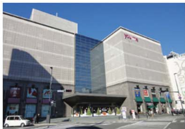
Yumetown Yumesaito 砂站タウン夢彩都

長崎市濱町10-21 WITH長崎4F ☎050-3525-6127 營業時間，公休日因店鋪而異 收費P提供