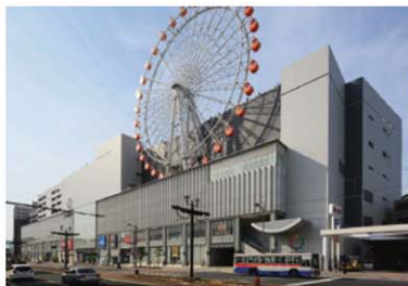
Mirai Nagasaki Cocowalk みらい長崎ココウォーク

長崎市尾上町1-1 ☎095-808-2500 10:00~21:00 ※無公休(一部分店鋪除外) 收費P提供