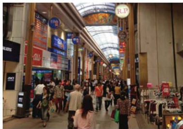
Hamanomachi Arcade 浜町アーケード