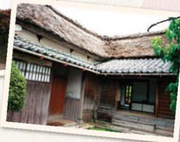
Samurai residence 武家屋敷