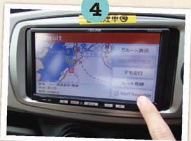
選擇目的地後點選「Start Navigation」